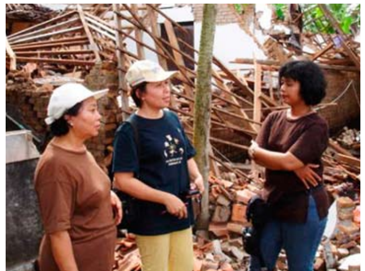
Miembros del equipo de SD Indonesia, evalúan el daño causado por el terremoto en Jogjakarta.

Durante el año, la Junta Directiva celebró 2 reuniones. La primera, desde agosto 2005, se realizó en Inglaterra en Febrero de 2006. Los temas tratados incluyeron el desarrollo de la Red Susila Dharma, nuestra presencia dentro de la Asociación Subud, con otras ONG y con las empresas, y nuestra participación en las Naciones Unidas. También se trataron estrategias con asociaciones, monitoreo y evaluación, publicaciones, coordinación con otras Ramas y con los ayudantes, actualización de la página web, capacitación y educación, donaciones, promoción de proyectos, recaudación de fondos, auto monitoreo y revisión del funcionamiento del proyecto. La segunda reunión se llevó a cabo en Bangalore, India, en agosto, conjuntamente con la Reunión General Anual de SDIA. A este encuentro asistieron muchos miembros de la Junta Directiva, de los SD Nacionales, líderes de proyectos y ayudantes internacionales. Este fue un encuentro muy amplio, en el que todos pudimos explorar la manera en que los miembros veían la necesidad que tenía la Junta Directiva y el Ejecutivo de aumentar el valor de lo que hacen. Durante la reunión, los miembros de la Junta fueron muy explícitos en su creencia de la necesidad de expandir y hacer más profunda una relación activa entre ellos mismos, los SD Nacionales, los proyectos y los miembros. Este fue un tema recurrente durante los cuatro días que duró la reunión. Por