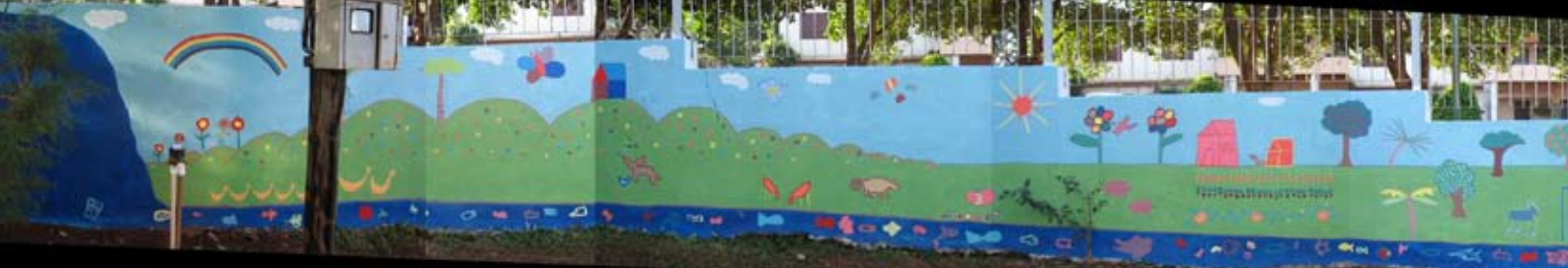
Mural de los niños del proyecto 'Child's Garden of Peace.