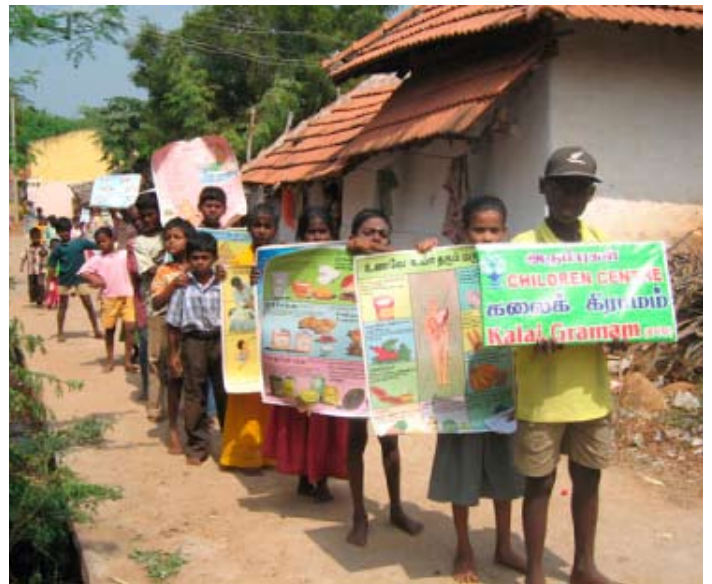
Programa de Sanidad Educativa en el Centro para la Cultura y el Desarrollo, Madurai, India.

Republica Democrática de Congo – SD RD Congo