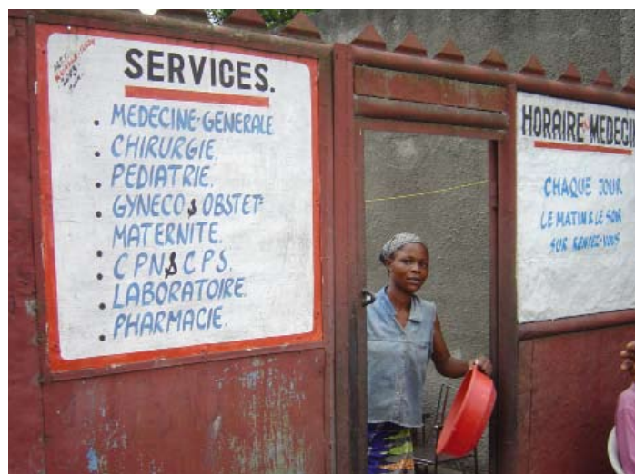
Clinica de Maternidad Yenge, en Kinshasa, R.D Congo.

A través del estatus de SDIA, como organización no gubernamental sin ánimo de lucro (ONG), con Estado Consultivo con las Naciones Unidas, el año pasado, ocho miembros fueron