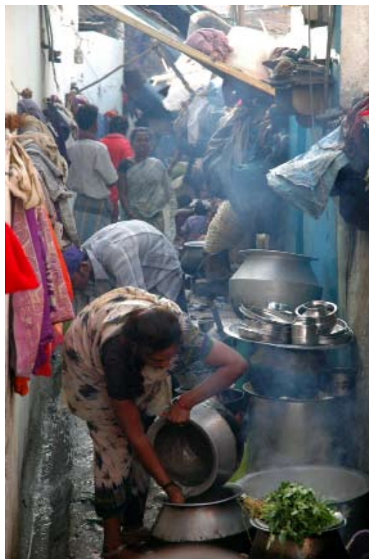
Comunidad Railway en Bangalore, India, localidad del Proyecto Anisha.