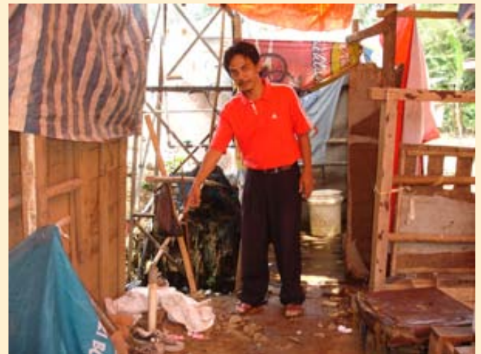
Ketua RT Cawang sedang menunjukkan tempat lokasi pemasangan