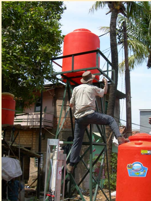
Pemasangan instalasi SkyHydrant di Cawang

SkyJuice merupakan organisasi yang bergerak di bidang penyediaan air bersih bagi negara berkembang. Sejak tahun 2005 SkyJuice telah menyumbang lebih dari 300 mesin ke seluruh dunia, termasuk Timor Timur, India, Indonesia, Kenya, Nepal, Oman, Sri Lanka, Pakistan dan Thailand. Di Indonesia, mereka telah menyumbangkan mesin tersebut di Aceh pada tahun 2004. Selain itu mereka juga menyumbangkan mesin tersebut di daerah Gunung Kidul, Wonosari, Sleman, dan Klaten.