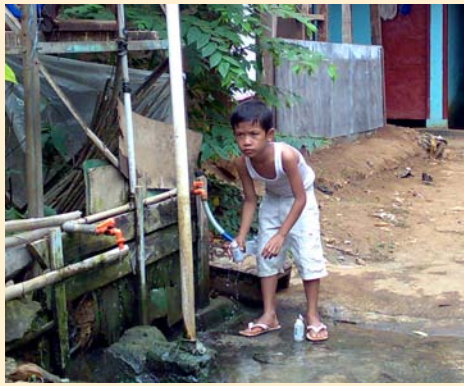
sebelumnya, sulit untuk memperoleh air bersih di lokasi ini

untuk pemasangan mesin ini di daerah Cawang, Kramat Jati, Jakarta Timur, karena lokasi ini dapat memenuhi persyaratan yang diajukan SkyJuice yakni tersedianya area lokasi seluas 9 m 2 untuk pembangunan tangki dan pemasangan pompa air, sumber air bukan berasal dari laut (air asin) serta dapat digunakan oleh masyarakat komunitas, sekolah atau rumah sakit.