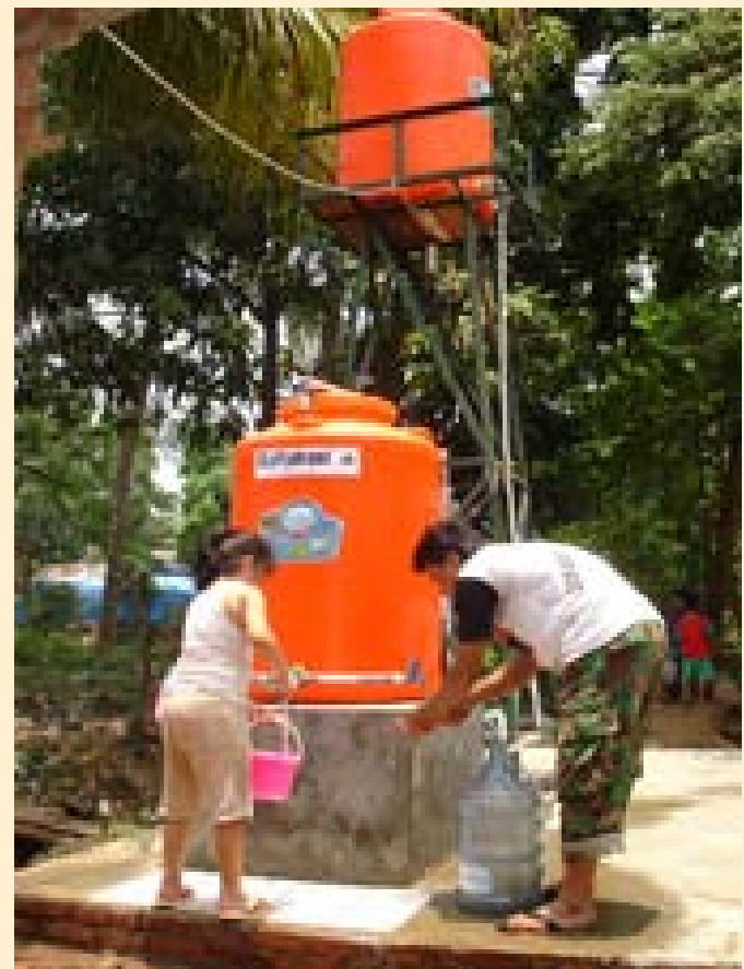
Setiap harinya air bersih sangat dibutuhkan oleh komunitas Cawang

SkyJuice merupakan organisasi yang bergerak di bidang penyediaan air bersih bagi negara berkembang. Sejak tahun 2005 SkyJuice telah menyumbang lebih dari 300 mesin ke seluruh dunia, termasuk Timor Timur, India, Indonesia, Kenya, Nepal, Oman, Sri Lanka, Pakistan dan Thailand. Di Indonesia, mereka telah menyumbangkan mesin tersebut di Aceh pada tahun 2004. Selain itu mereka juga menyumbangkan mesin tersebut di daerah Gunung Kidul, Wonosari, Sleman, dan Klaten.